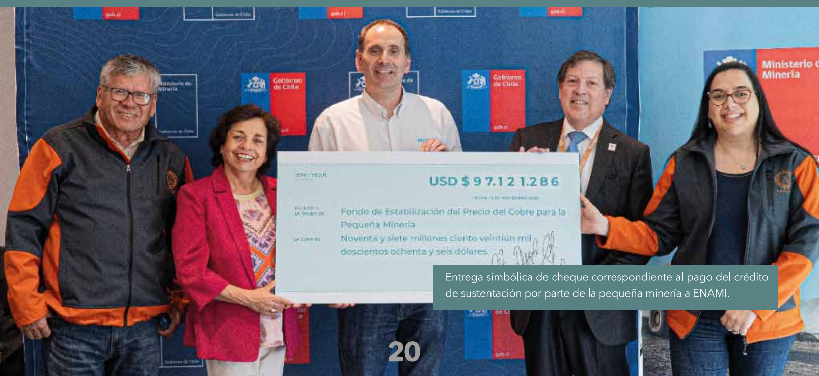
Entrega simbólica de cheque correspondiente al pago del crédito de sustentación por parte de la pequeña minería a ENAMI.