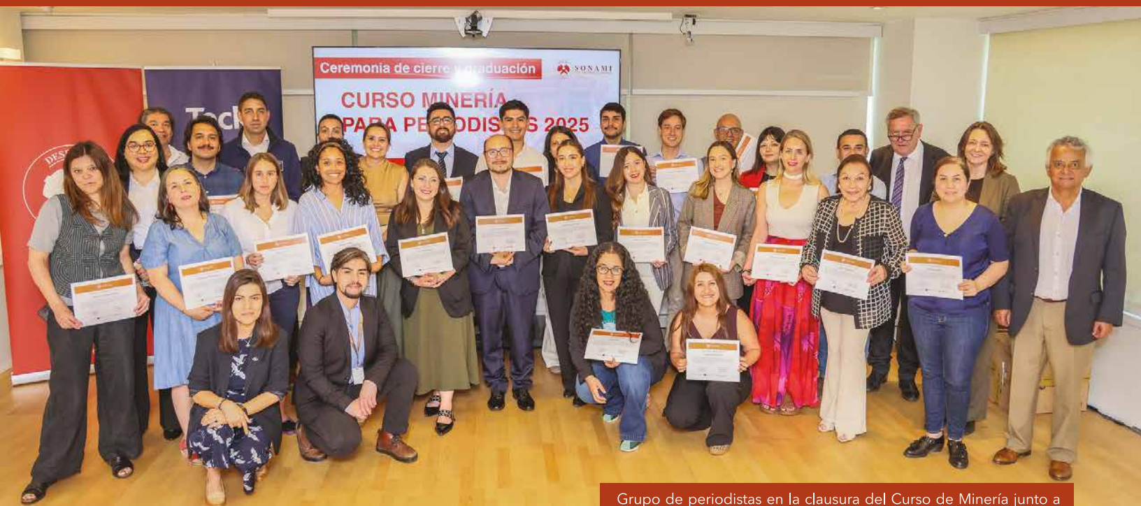
Grupo de periodistas en la clausura del Curso de Minería junto a ejecutivos de SONAMI.