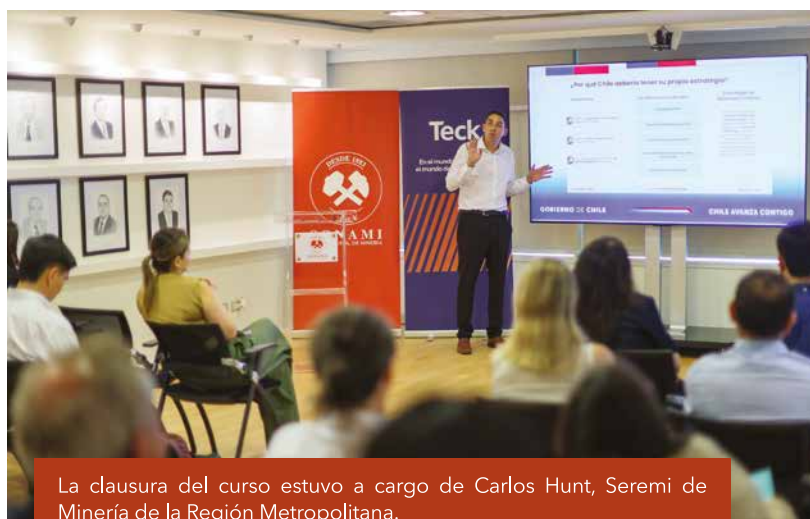
La clausura del curso estuvo a cargo de Carlos Hunt, Seremi de Minería de la Región Metropolitana.

Por su parte, los periodistas participantes destacaron la calidad de los contenidos y la oportunidad de profundizar en temáticas cruciales para el desarrollo minero del país, con expertos de cada tema específico. Para lograr la certificación, los 52 profesionales debieron cumplir con al menos un 90% de asistencia a las sesiones programadas.