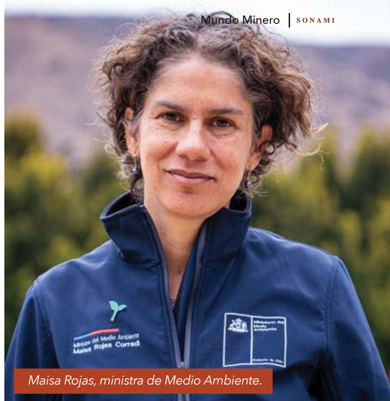
Maisa Rojas, ministra de Medio Ambiente.

Aunque la ministra se comprometió a generar instancias de diálogo, condicionó la conformación de una mesa multisectorial a la revisión previa de las observaciones ingresadas por SONAMI en la consulta pública. Frente a esto, el presidente del gremio expresó su sorpresa, señalando que “el Ministerio de Medio Ambiente ya cuenta con información completa de ENAMI, Sernageomin y el Ministerio de Minería sobre la ubicación de faenas y concesiones. Esta descoordinación entre organismos genera desconfianza en el proceso” .