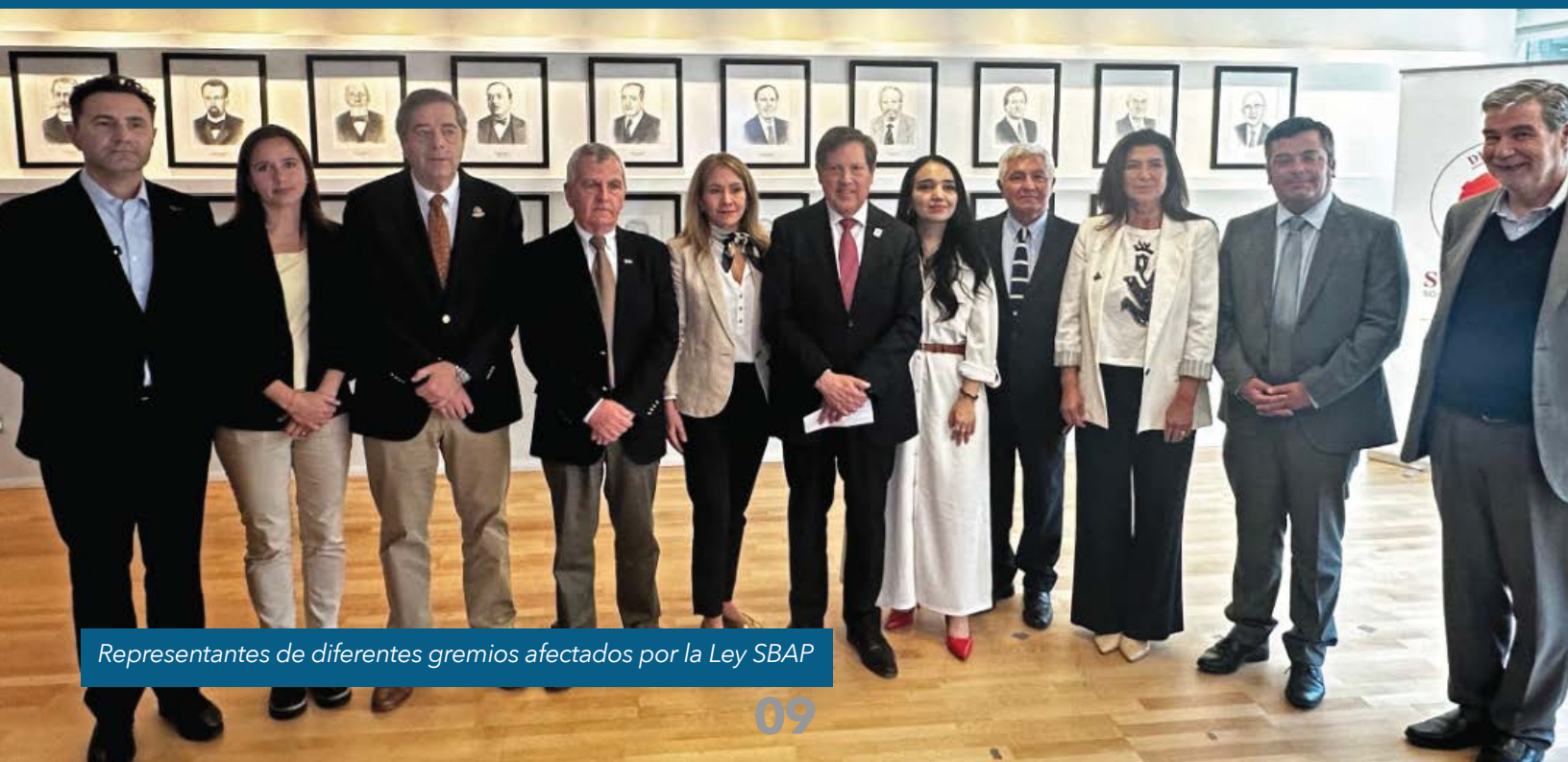
Representantes de diferentes gremios afectados por la Ley SBAP