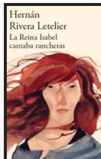
"La Reina Isabel cantaba rancheras" Hernán Rivera Letelier.