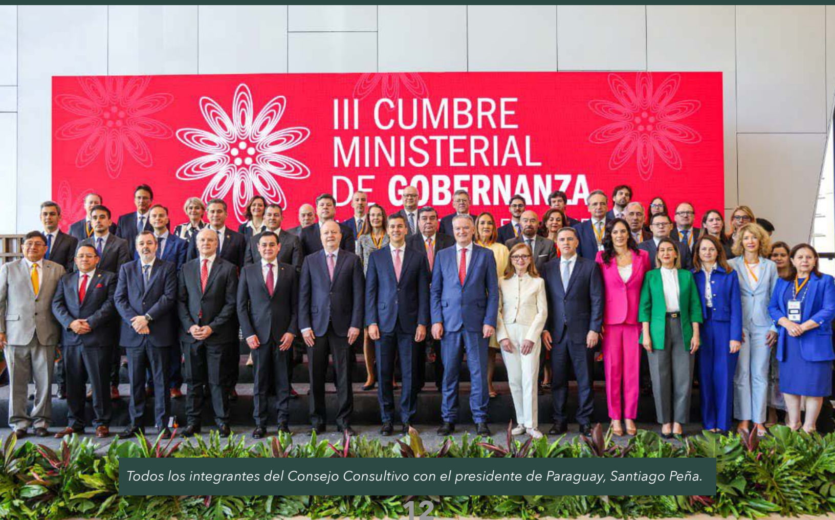
Todos los integrantes del Consejo Consultivo con el presidente de Paraguay, Santiago Peña.