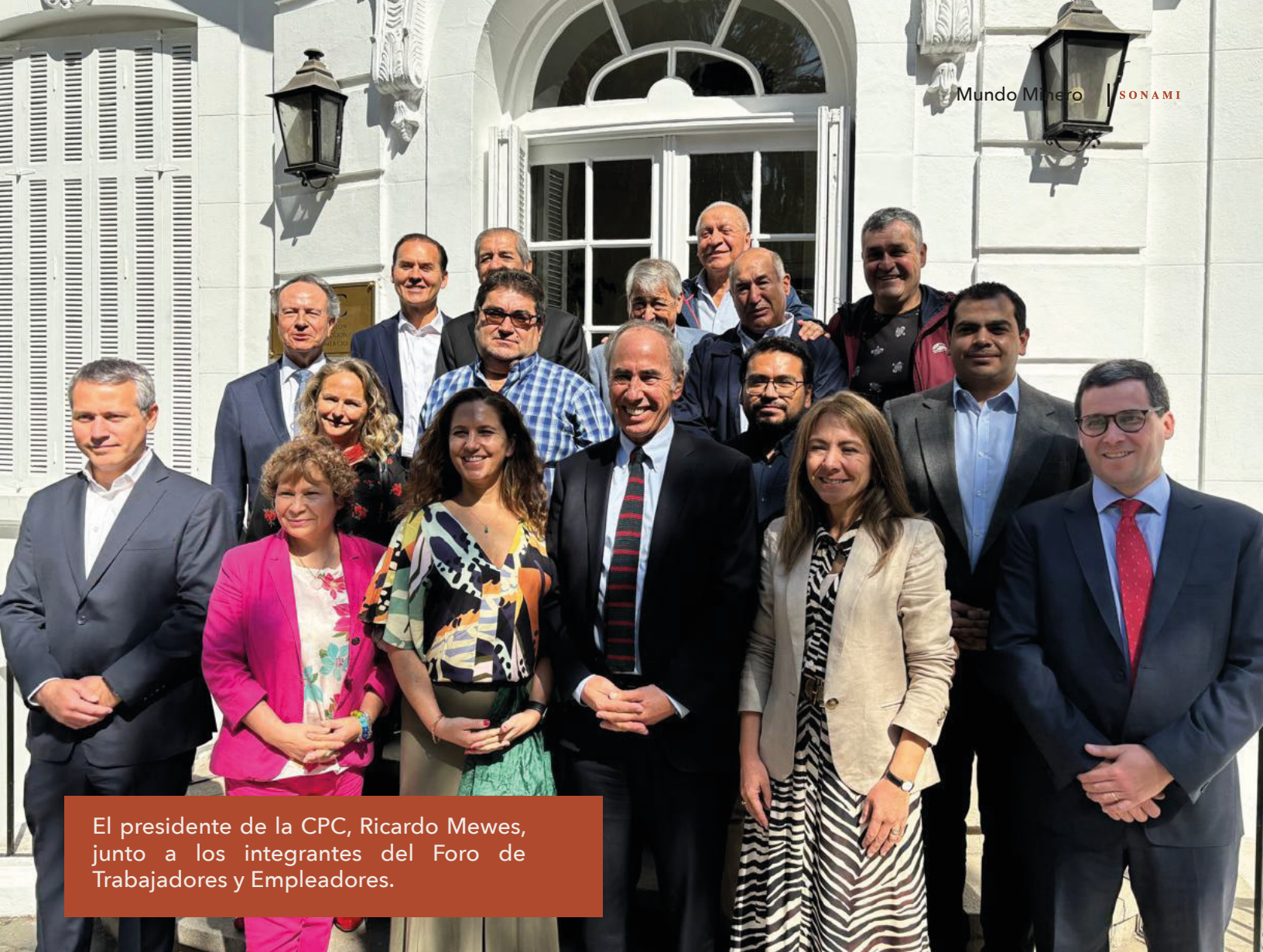
El presidente de la CPC, Ricardo Mewes, junto a los integrantes del Foro de Trabajadores y Empleadores.

en el caso de contratación de personas en desempleo de larga duración; capacitación y formación continua; y aprovechar la experiencia de las personas de mayor edad para que formen a trabajadores de menos experiencia, especialmente en la enseñanza técnico-profesional.