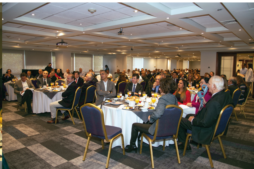
Una masiva asistencia tuvo el lanzamiento de libro sobre los 140 años de SONAMI.