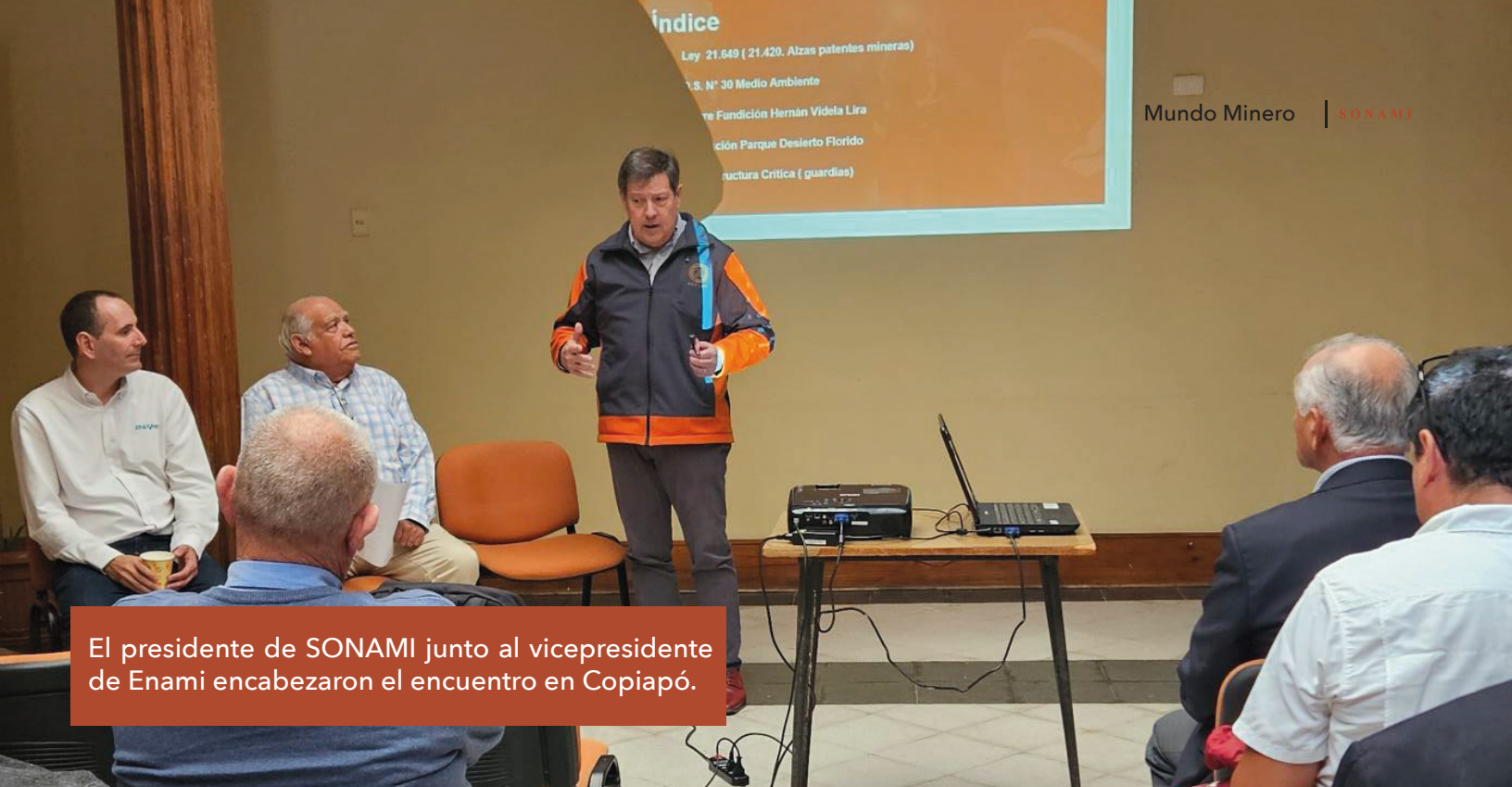
El presidente de SONAMI junto al vicepresidente de Enami encabezaron el encuentro en Copiapó.