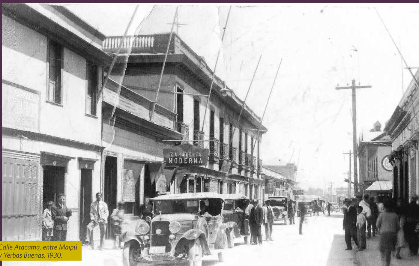
Calle Atacama, entre Maipú y Yervas Buenas, 1930.