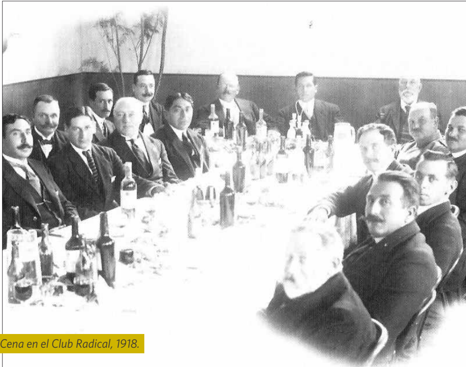
Cena en el Club Radical, 1918.

padre y transformarse en un empresario industrial, con el establecimiento de una casa de moneda y una fundición para fabricar armas y cañones.