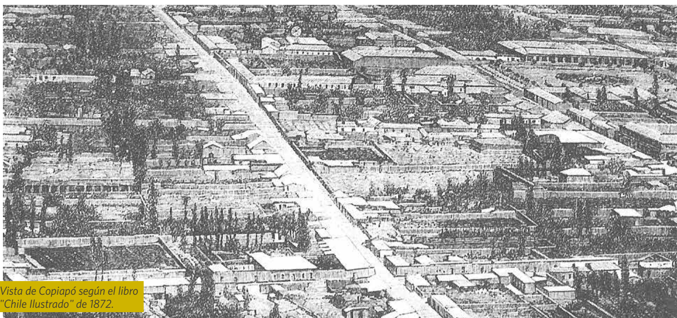
Vista de Copiapó según el libro "Chile Ilustrado" de 1872.

Sin duda, el auge minero propició el desarrollo urbano de Copiapó a partir del siglo XIX, y atrajo el arribo de pobladores, comerciantes, mineros, viajeros -fue el caso de Charles Darwin, Rodolfo Phillipi y Paul Treutler- y empresarios como Charles Lambert con su Compañía Inglesa de Copiapó y otras instalaciones en la zona, entre tantos que recorrieron el desierto en busca de riqueza.