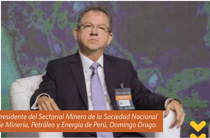
Presidente del Sectorial Minero de la Sociedad Nacional de Minería, Petróleo y Energía de Perú, Domingo Drago.