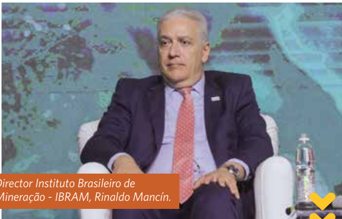
Director Instituto Brasileiro de Mineração - IBRAM, Rinaldo Mancin.

El representante gremial dijo que “la minería es una palanca permanente para promover el desarrollo y representa el 10% del Producto Interno Bruto. Contamos con una cartera de 47 proyectos, que representan un potencial de 54 mil millones de dólares. Para los 2 próximos años tenemos una expectativa de inversión de más de 6 mil millones de dólares”.