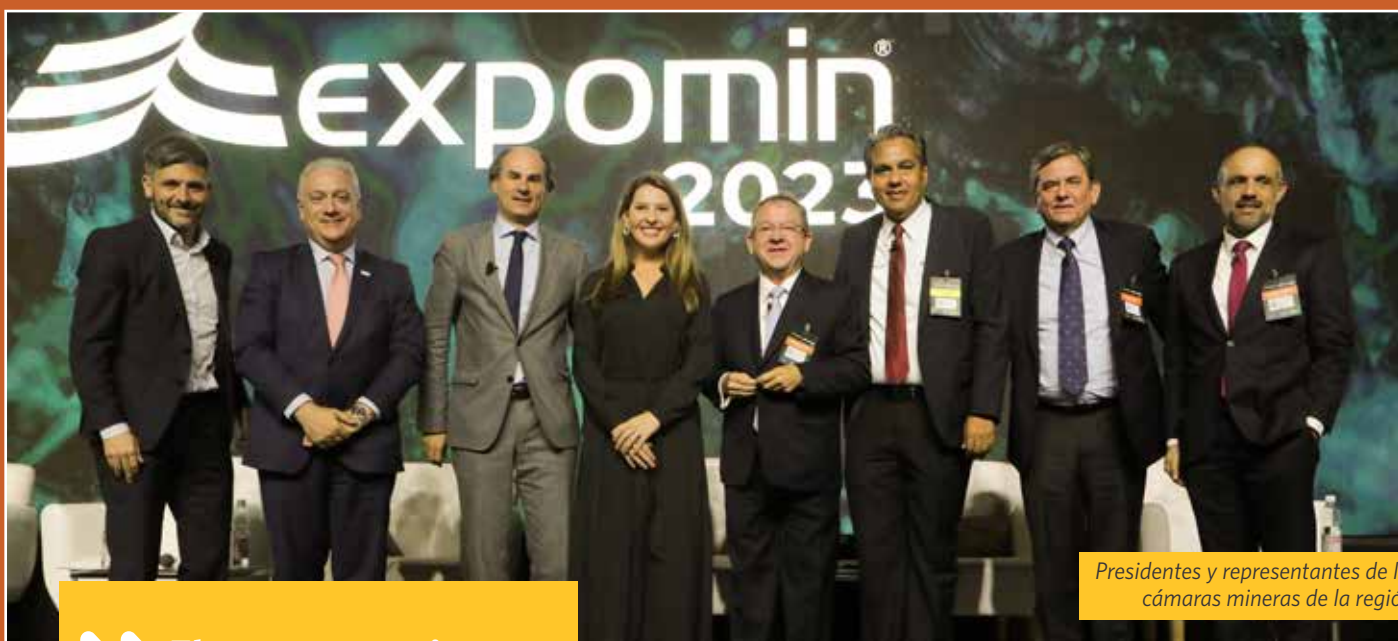
Presidentes y representantes de las cámaras mineras de la región.

SONAMI Y PAÍSES DE LATINOAMÉRICA ANALIZARON LA ACTUALIDAD MINERA REGIONAL EN EXPOMIN