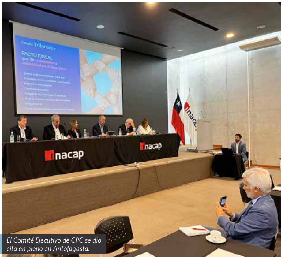
El Comité Ejecutivo de CPC se dio cita en pleno en Antofagasta.