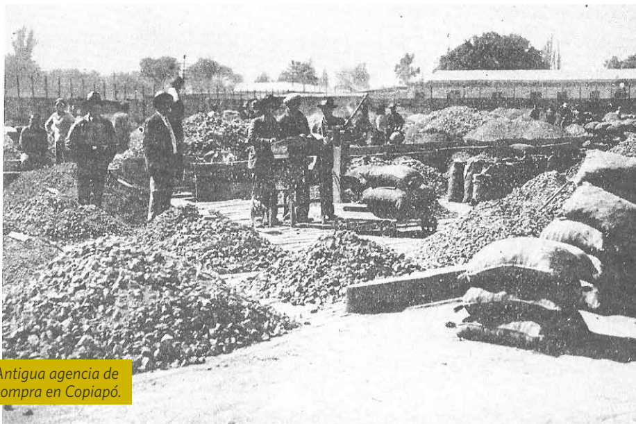
Antigua agencia de compra en Copiapó.

(1811), Arqueros (1825), Chañarcillo (1832), Tres Puntas (1848) y Caracoles (1871) con explotaciones de oro, plata y cobre. Entre ellos destacó la explotación de las minas de Chañarcillo que marcó una etapa de cuantiosa riqueza argentífera.