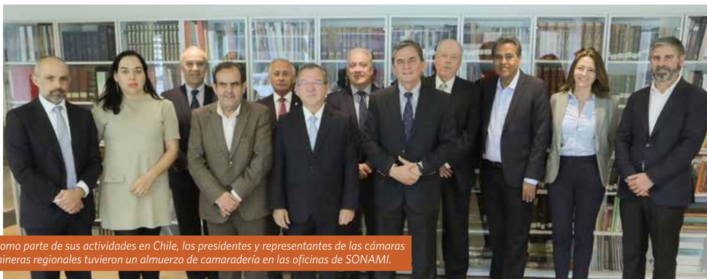
Como parte de sus actividades en Chile, los presidentes y representantes de las cámaras mineras regionales tuvieron un almuerzo de camaradería en las oficinas de SONAMI.