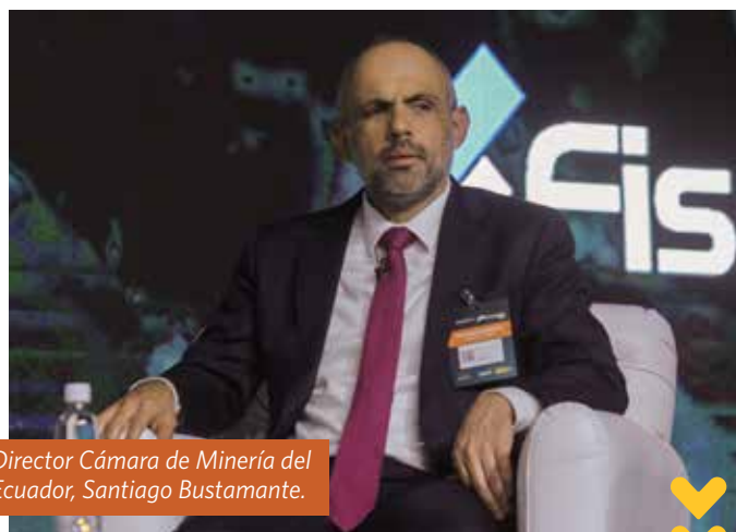
Director Cámara de Minería del Ecuador, Santiago Bustamante.

La actualidad minera del país centroamericano está en crecimiento y, según Cuevas, “estamos recién comenzando en esto, aún tenemos mucho desconocimiento, pero sabemos que la minería en Latinoamérica necesita un fuerte apoyo de los científicos ambientales, aplicando los mayores estándares de sostenibilidad y en el área social”.