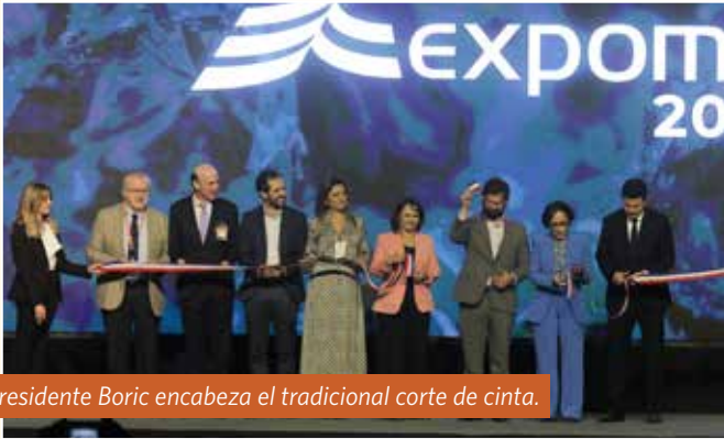
Presidente Boric encabeza el tradicional corte de cinta.

El presidente Gabriel Boric inauguró la XVII Exhibición y Congreso Internacional para la Minería, Expomin, que se emplaza en el nuevo recinto ferial Fisa, ubicada en la carretera 68.