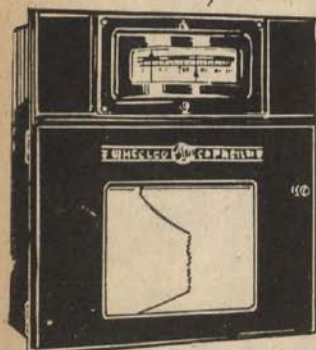
Pirómetro registrador WHEELCO modelo 7,000