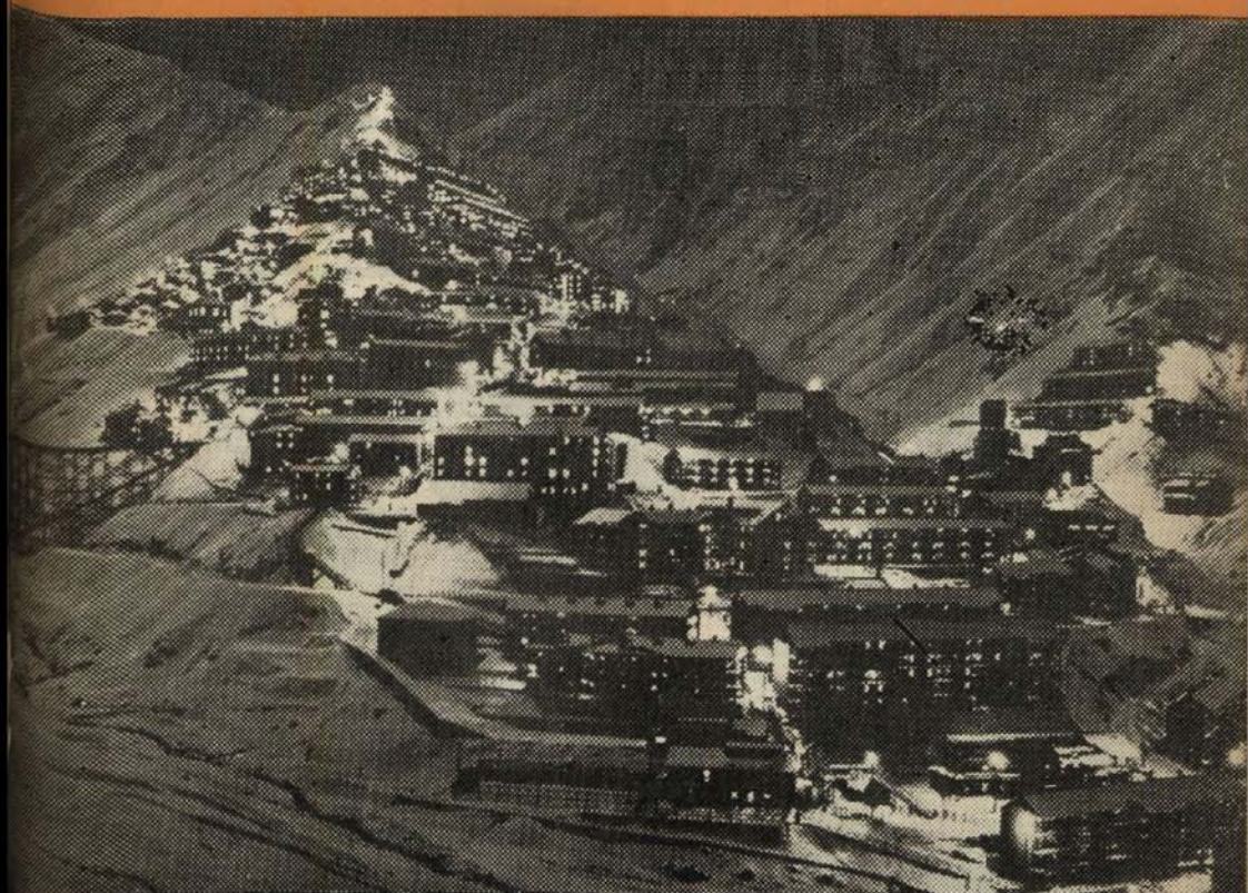
VISTA GENERAL DEL MINERAL DE "EL TENIENTE" DE LA "BRADEN COPPER MINING CO." UBICADO EN RANCAGUA, PROVINCIA DE O'HIGGINS.-