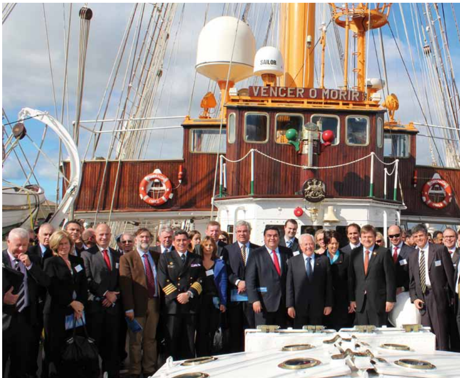
La delegación oficial chilena durante la celebración del Día Mundial de la Minería que se conmemoró en la ciudad australiana de Brisbane.

Encabezada por el ministro de Solminihac y el presidente de SONAMI