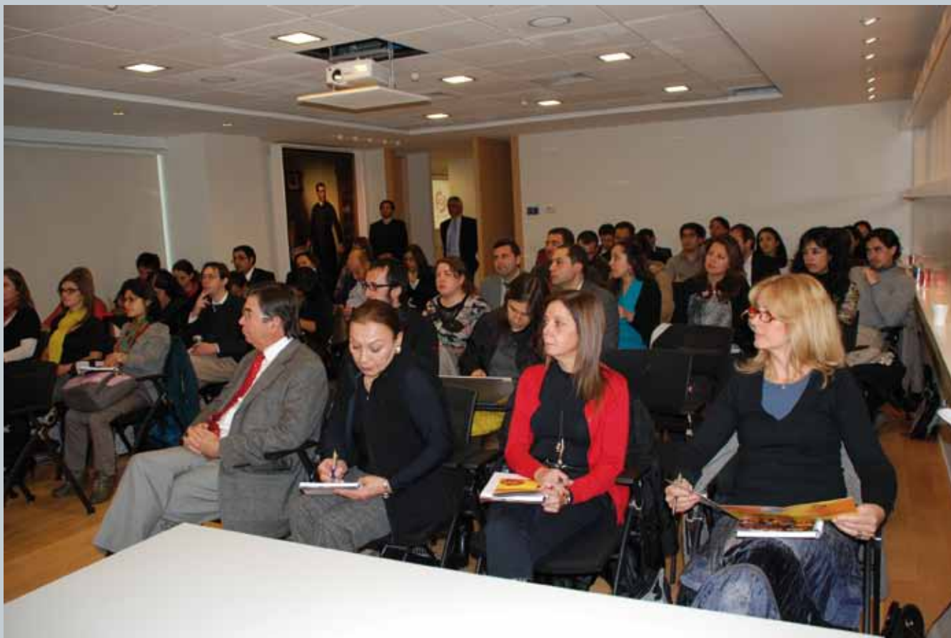
En su sesión inaugural, participaron 50 representantes de medios de comunicación, empresas asociadas y agencias de comunicaciones.