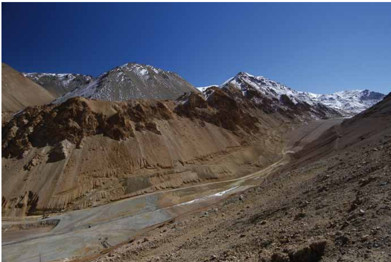
La mina El Indio, de Minera Barrick, es un caso emblemático de cierre de una operación minera.