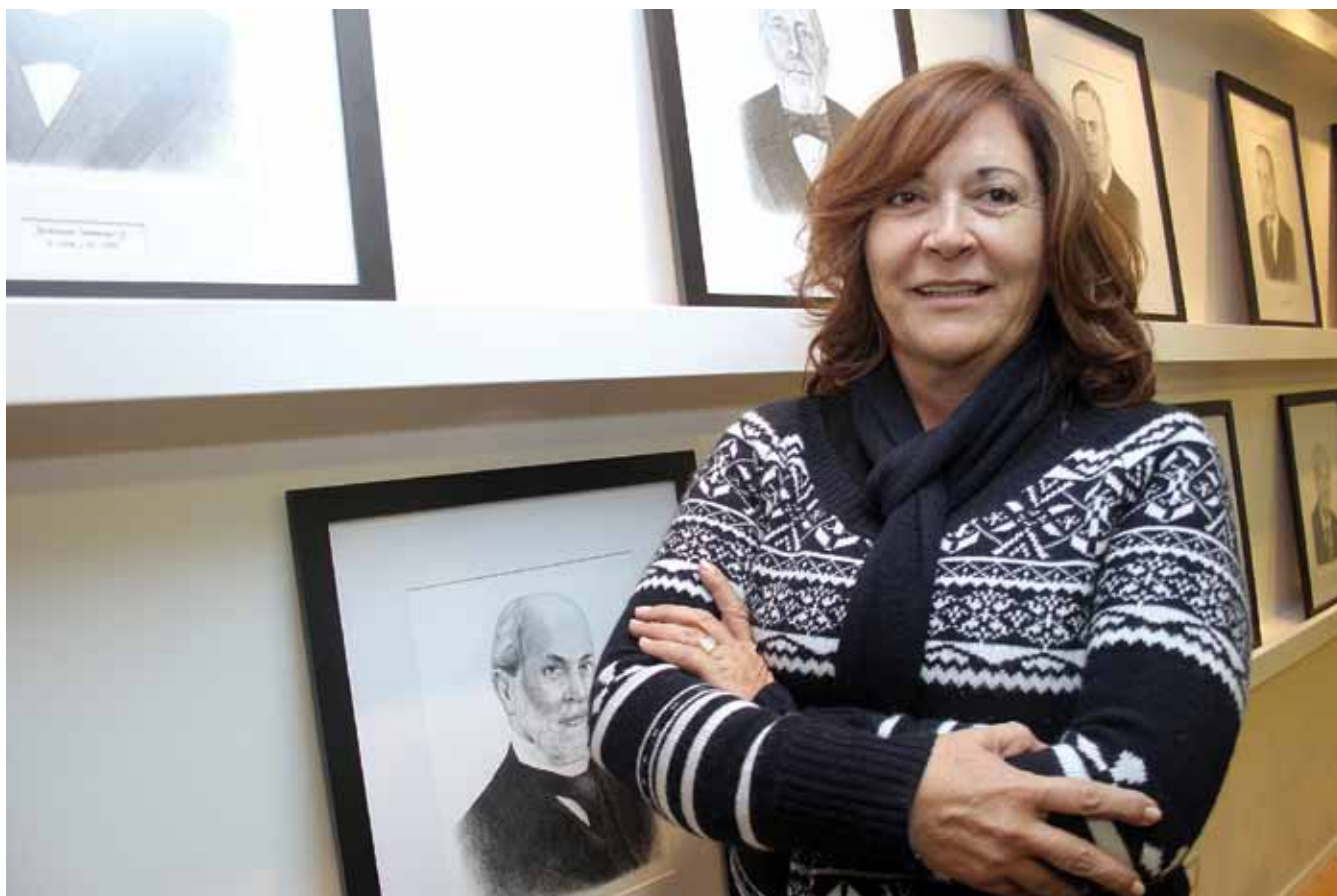
La dirigente expresa su inquietud respecto a iniciativas legales que pueden afectar el desarrollo futuro del sector de pequeña minería.

minería. Los gobernantes hacen las leyes sin tomar en cuenta quiénes son los que deben opinar con respecto a eso.