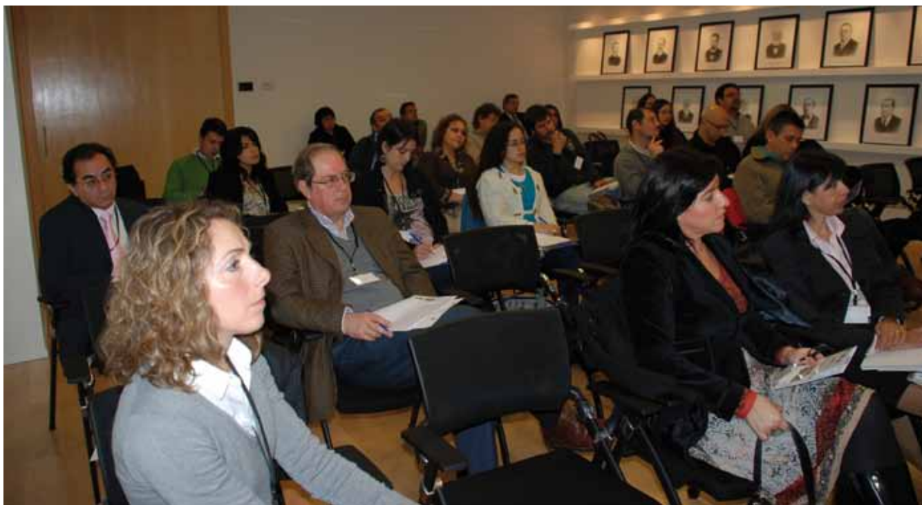
A la reunión en SONAMI asistieron representantes de la industria, asociaciones gremiales y universidades.