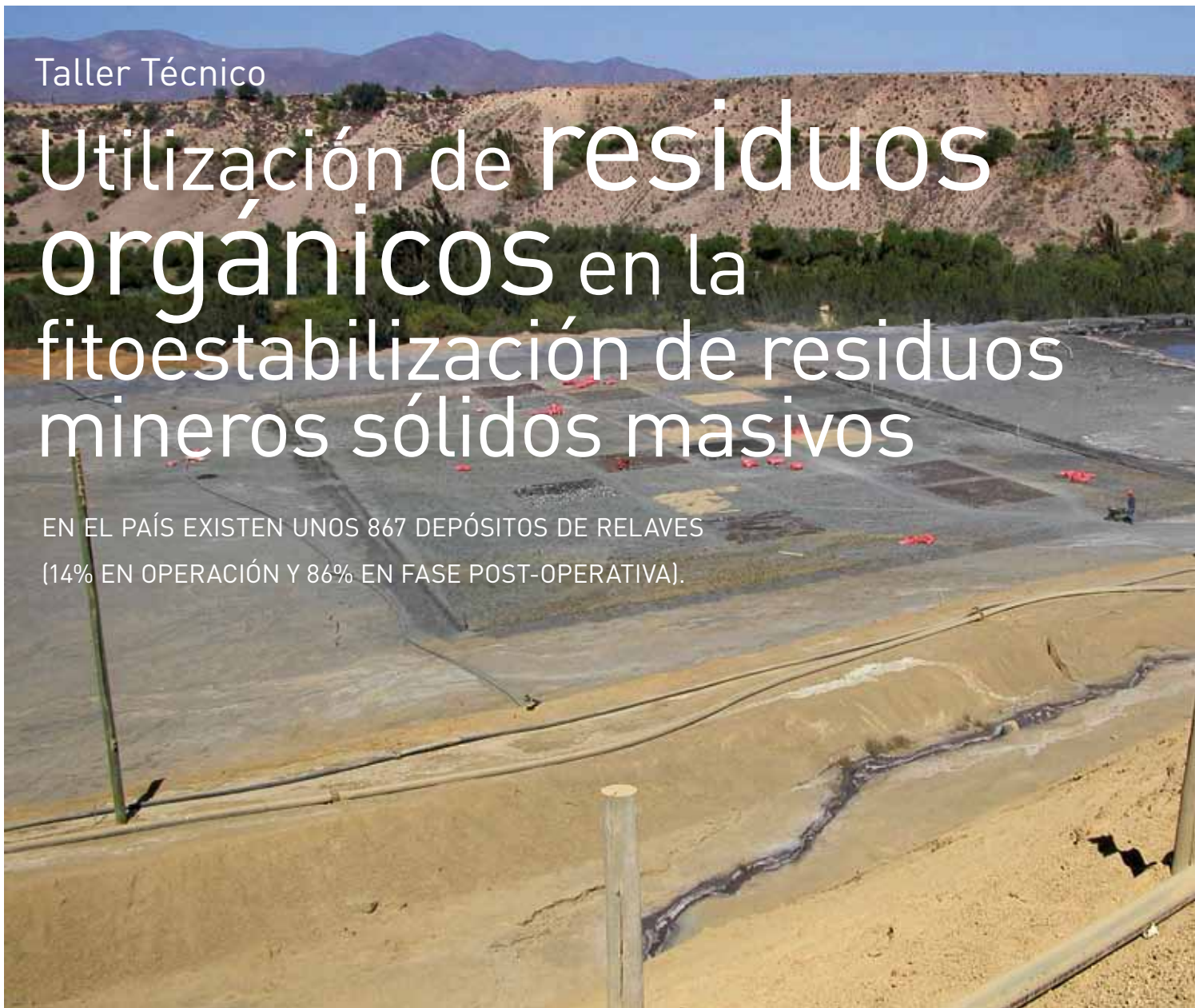
Tranque de relaves La Cocinera de la Planta Ovalle de Enami, lugar en que se hizo un ensayo piloto de fitoestabilización.

EN EL PAÍS EXISTEN UNOS 867 DEPÓSITOS DE RELAVES (14% EN OPERACIÓN Y 86% EN FASE POST-OPERATIVA).