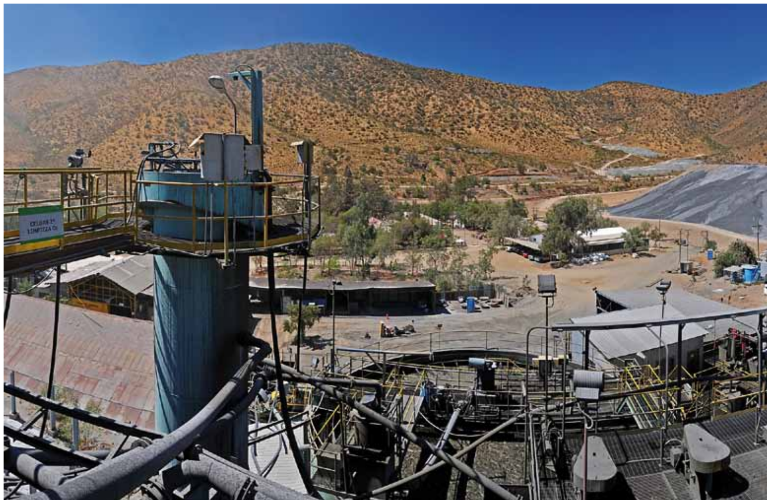
Minera Altos de Punitaqui procesa en su planta una producción de 3 mil toneladas de mineral por día.

mineral por día procesada en planta y entregamos a exportación 40 mil toneladas anuales de concentrados de cobre.