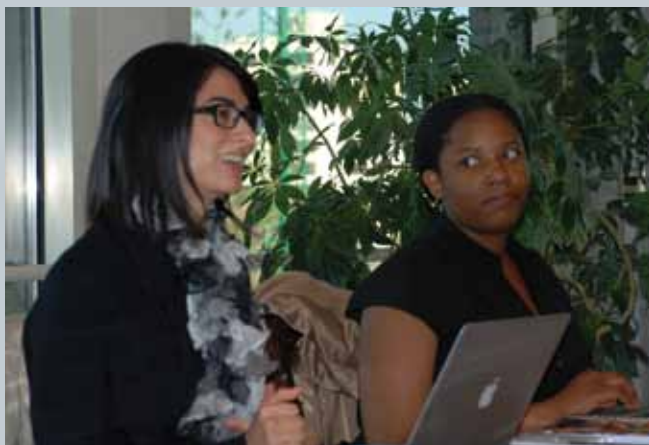
Las estudiantes de la Universidad de Columbia visitaron SONAMI.

Como parte del convenio suscrito entre SONAMI y la Universidad de Columbia, ejecutivos de SONAMI se reunieron con las dos estudiantes de la Maestría en Administración Pública en Prácticas de Desarrollo de la Escuela de Asuntos Internacionales y Públicos que realizarán una pasantía en una empresa minera chilena.