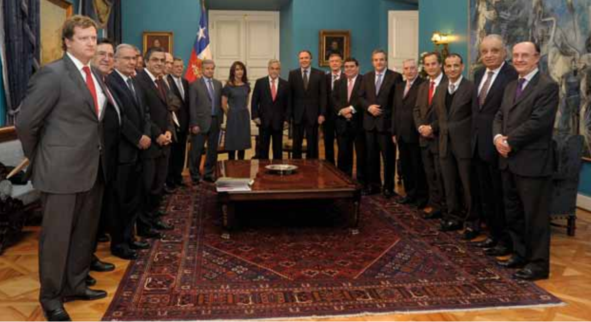
El Presidente Piñera junto a la cúpula de la CPC y otros empresarios en el Palacio de la Moneda.