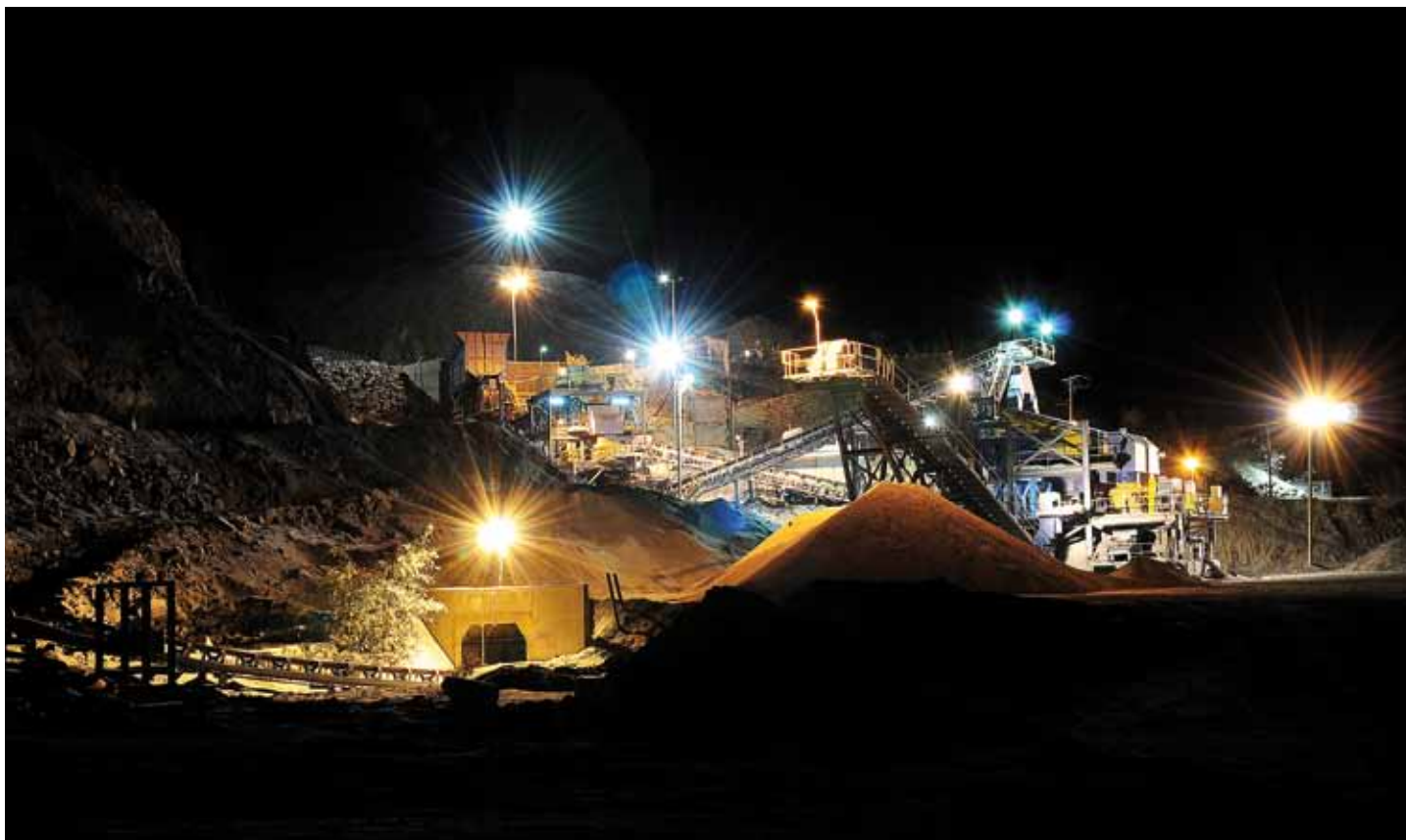
Altos de Punitaqui cuenta con una dotación directa de 206 trabajadores, que provienen mayoritariamente de la comuna.