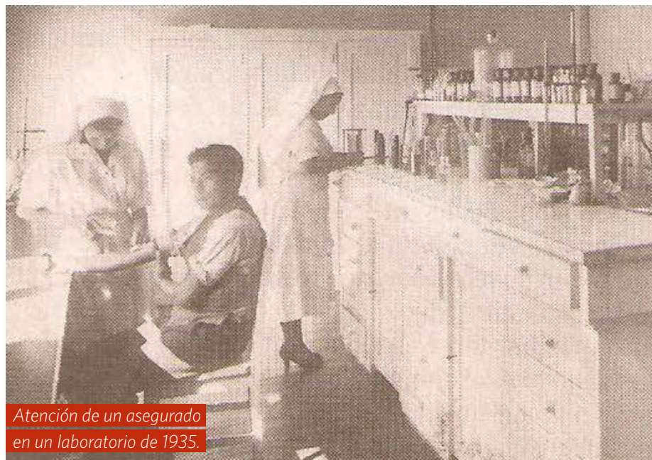
Atención de un asegurado en un laboratorio de 1935.

Antiguamente una persona infectada se debatía entre la vida y la muerte, mientras la ciencia de la salud iba evolucionando de lo sanitario a lo epidémico. Y no menor gravedad revestía la mortalidad infantil