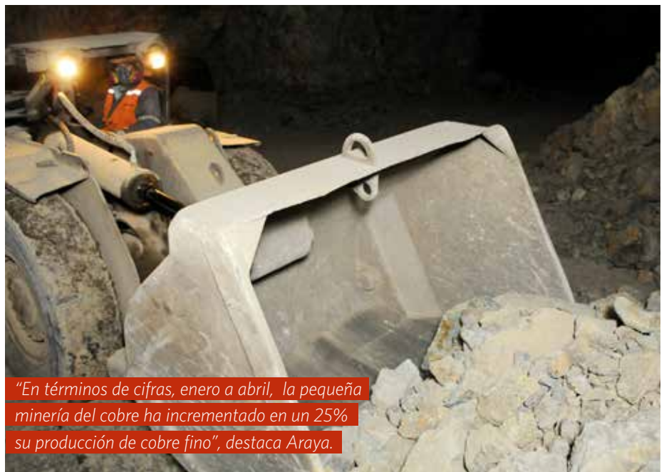
“En términos de cifras, enero a abril, la pequeña minería del cobre ha incrementado en un 25% su producción de cobre fino”, destaca Araya.

En el fondo, se trata de buscar alternativas financieras que apoyen a los productores con una mirada más propositiva, pensando en que la situación que se vive es atípica, y no tan enmarcadas a una situación de normalidad./BM