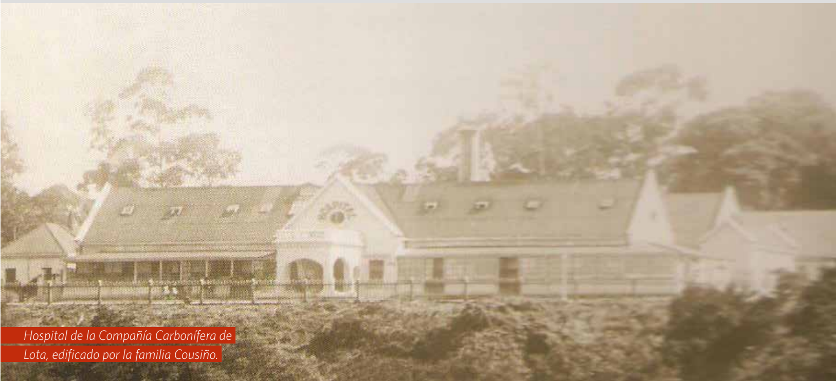
Hospital de la Compañía Carbonífera de Lota, edificado por la familia Cousiño.

CUANDO EL CORONAVIRUS ALCANZA LOS 10 MILLONES DE CONTAGIADOS EN EL MUNDO Y MÁS DE 260 MIL CASOS EN CHILE CON UN IMPORTANTE NÚMERO DE FALLECIDOS, SURGE LA PREGUNTA SI LA HUMANIDAD SUFRIÓ ALGO PARECIDO EN EL PASADO, CÓMO AFECTÓ A LAS PERSONAS EN SU ÉPOCA Y QUÉ OCURRIÓ CON LA VIDA COTIDIANA DE ANTAÑO.