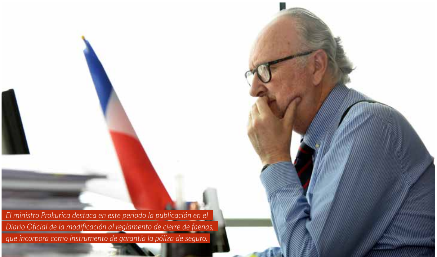
El ministro Prokurica destaca en este periodo la publicación en el Diario Oficial de la modificación al reglamento de cierre de faenas, que incorpora como instrumento de garantía la póliza de seguro.

A lo anterior habría que agregar que, gracias a Dios, el precio del cobre ha ido mejorando. Ahora su evolución futura va a depender qué va ocurrir con la pandemia, pero por lo menos hemos ido observando un alza en el precio del metal y eso obedece también a que China ha ido recuperando su economía y también a la reapertura de Europa y Estados Unidos, que están tomando cierta normalidad. Creo que el precio del cobre va a mejorar. /BM