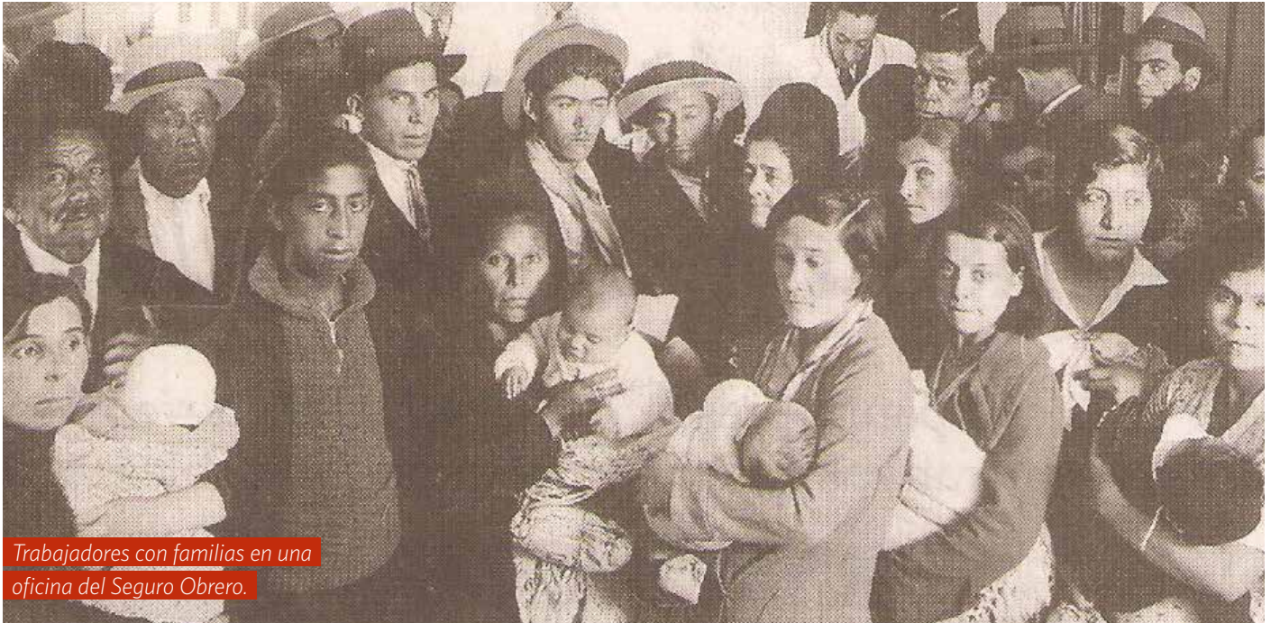
Trabajadores con familias en una oficina del Seguro Obrero.

el contacto con un gusano de las aguas servidas que contaminaba los pies de los mineros.