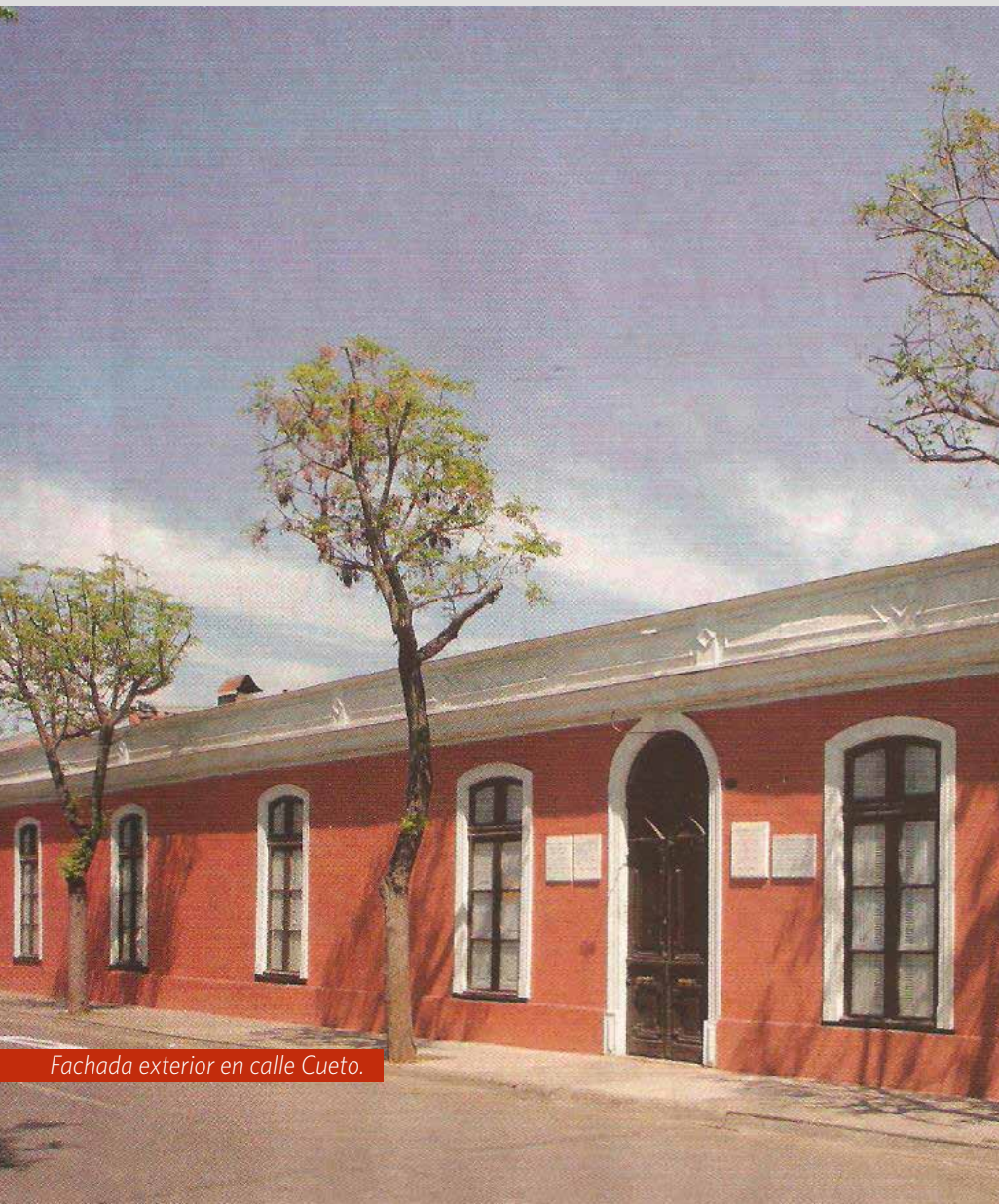
Fachada exterior en calle Cueto.

ENTRE LOS HOMBRES PÚBLICOS Y RECONOCIDOS EN LA HISTORIA DE CHILE, SOBRESALE LA FIGURA DE IGNACIO DOMEYKO POR SUS AMPLIAS CONTRIBUCIONES AL DESARROLLO DE LA MINERÍA Y A LA EDUCACIÓN DEL SIGLO XIX, YA QUE PESE A SER POLACO DE ORIGEN, ÉL LLEGÓ A SENTIRSE UN CHILENO MÁS EN NUESTRO PAÍS.