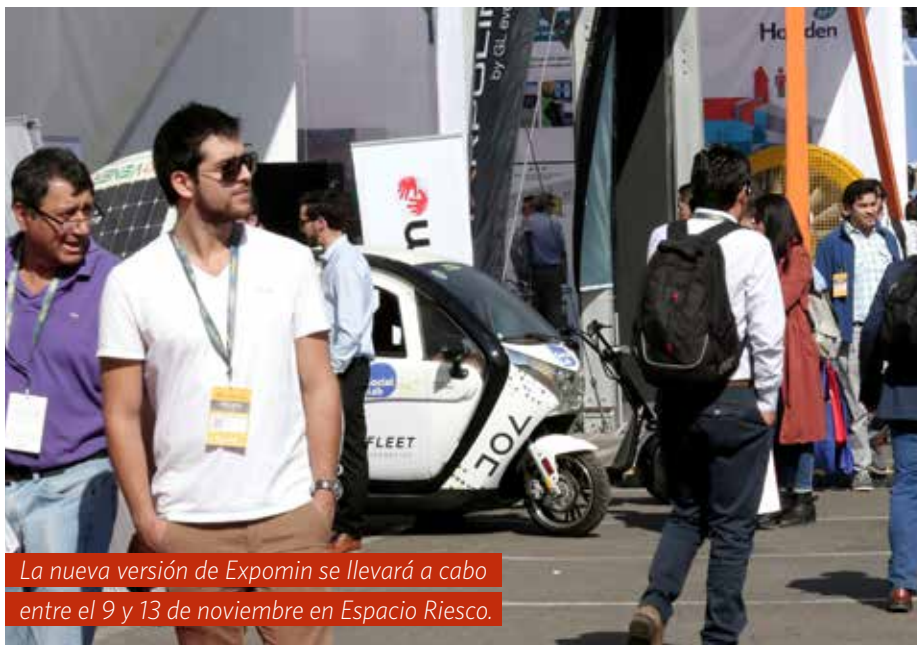
La nueva versión de Expomin se llevará a cabo entre el 9 y 13 de noviembre en Espacio Riesco.

“EXPOMIN ES LA ÚNICA PLATAFORMA QUE CONGREGA A TODA LA CADENA DE VALOR DEL SECTOR, AUTORIDADES PÚBLICAS, PRIVADAS, INVERSIONISTAS, PROVEEDORES, CONTRATISTAS, ENTES FISCALIZADORES Y ESO HACE QUE EL ENCUENTRO SEA MUY ENRIQUECEDOR”.