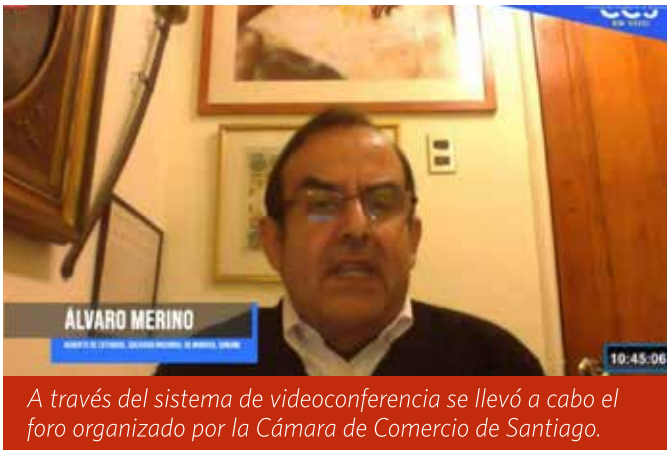
A través del sistema de videoconferencia se llevó a cabo el foro organizado por la Cámara de Comercio de Santiago.

Gremios productivos analizaron la actual situación de sus sectores y esbozaron escenarios futuros.