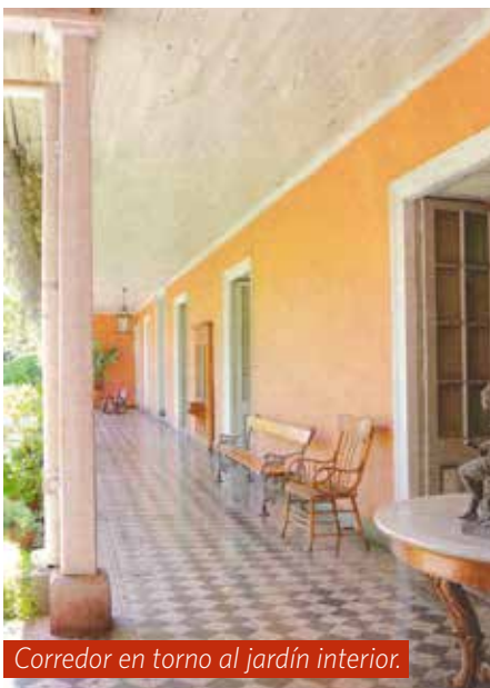
Corredor en torno al jardín interior.

la primera mitad del siglo XIX. Entonces él procedió a hacerle arreglos como mejorar su fachada, levantar el techo y ensanchar los corredores, transformándose en uno de los inmuebles fundacionales al poniente del casco histórico de Santiago, siendo parte después del barrio Yungay. De hecho, éste fue considerado un sector característico de la forma de vida de la segunda mitad del siglo XIX.