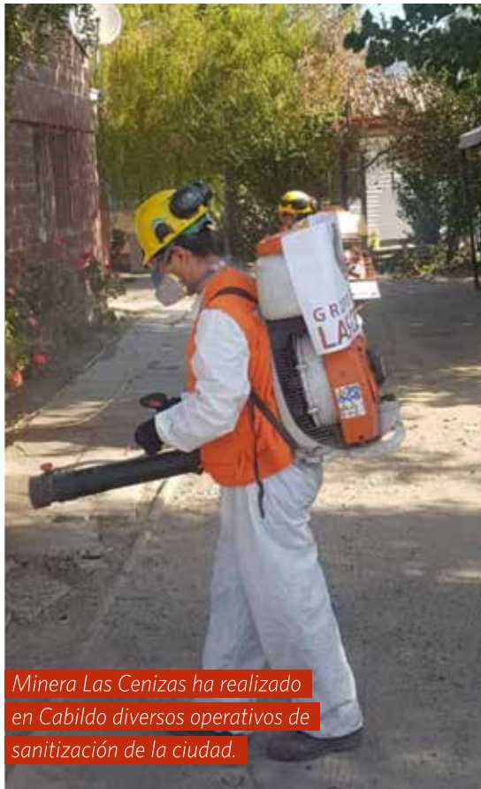
Minera Las Cenizas ha realizado en Cabildo diversos operativos de sanitización de la ciudad.

Por su parte, Codelco ha realizado distintas contribuciones, como por ejemplo, la entrega de equipos PCR, insumos médicos e implementos de sanitización, como pulverizadores, desinfectantes en aerosol y otros, a servicios de salud de distintas comunas del país. También la instalación de un hospital de campaña en el Estadio El Teniente, en conjunto con la Intendencia de la Región de O'Higgins, entre otros.