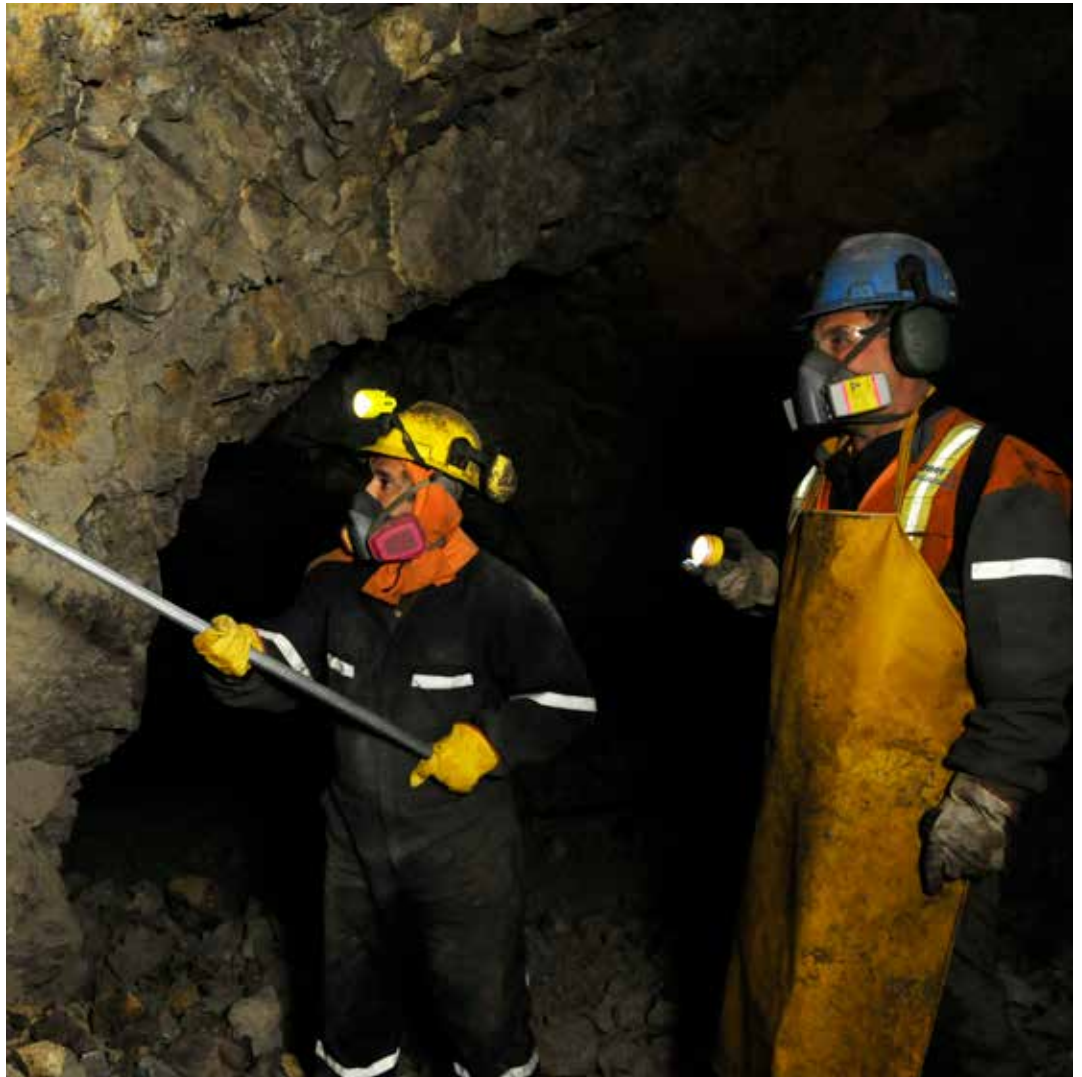
El abastecimiento de minerales a los poderes de compra de Enami se ha mantenido con normalidad durante este periodo.

El procesamiento de minerales de oro es otra de las inquietudes del sector y se promoverá la realización de un proyecto con apoyo de una Universidad, para diseñar una planta de pequeña escala que permita trabajar a esos pirquineros que por distancia, volumen y características del mineral no puede acceder a los poderes de compra de Enami y que también sirva de alternativa a la amalgamación. /BM